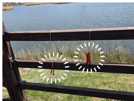
<비치된 펀치기 모습>

바. PreO에서 펀치기는 현장에 설치합니다. 각 컨트롤이 모여있는 구역이 3개 구역이 있습니다. 이곳에서는 펀치기를 2-3개 집단 설치합니다. 이 3개 구역에서는 모든 펀칭을 완료하시고 다음 순서로 이동하시기 바랍니다.